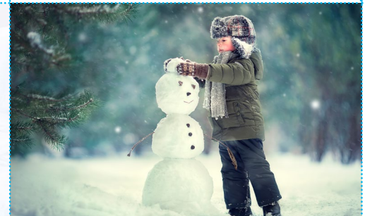
Einen Schneemann machen