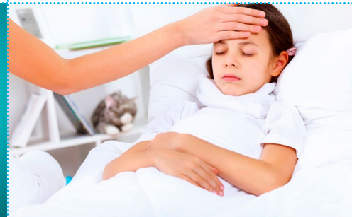
Sich müde und fiebrig fühlen