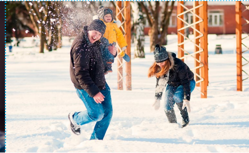
Eine Schneeballschlacht machen