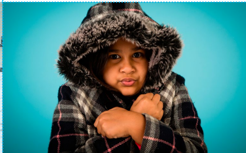
Zittern vor Kälte