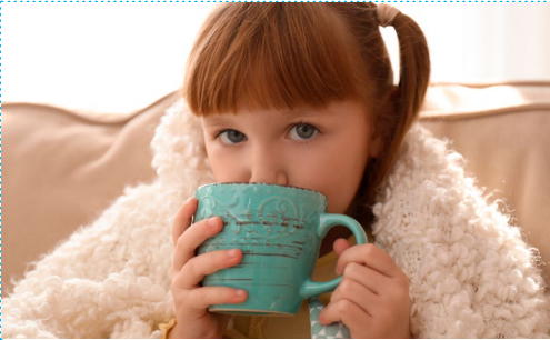
Heiße Schokolademilch trinken